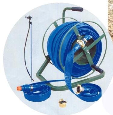
△ポータブルホースセット巻取機

ポータブル型ホースセットは50Mの巻き取り式ホースと、スタンド付のスプリンクラー5本セットの簡単に設置できる商品です☆